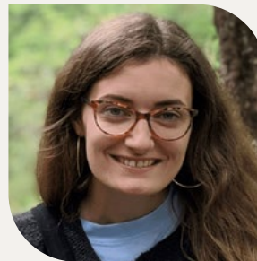
Lowri Ifor Ymddiriedolwr