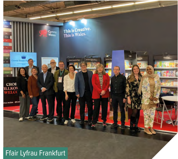
Ffair Lyfrau Frankfurt

Bydd y system newydd, KNK Publishing, yn ein galluogi ni i weithio'n fwy effeithiol, gyda mwy o wybodaeth sydd o ansawdd gwell ar flaenau ein bysedd, ac yn ein helpu ni i wella'n gwasanaethau i'r sector cyhoeddi. Bu tîm y Ganolfan yn gweithio'n agos gyda KNK (sydd yn arweinwyr yn y diwydiant) i ddatblygu, gweithredu a chyflwyno'r system newydd. Gwnaed y newid o'r hen system i'r newydd ym mis Mawrth 2024.