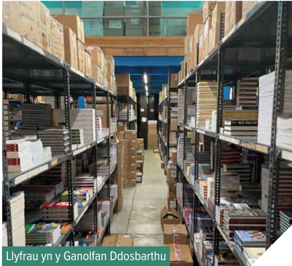
Llyfrau yn y Ganolfan Ddosbarthu